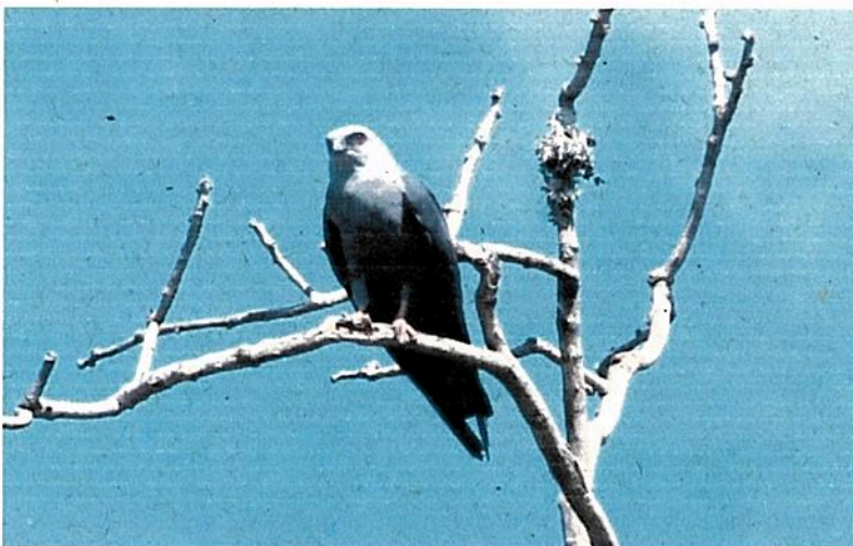
Foto 06: Exemplar da fauna local: Gavião-sauveiro, Sovi ( Ictinia plumbea ).