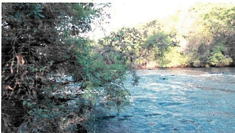
Foto 05: Rio Douradinho e parte da vegetação ciliar deste, próximo da área destinada à RPPN.