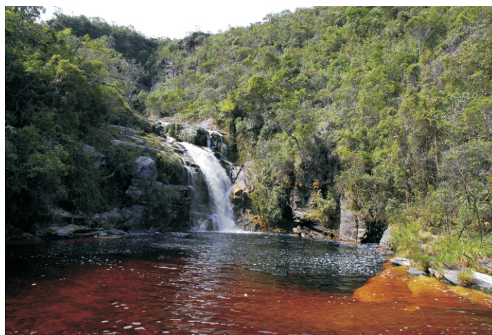
Cachoeira dos Macacos - Parque Estadual do Ibitipoca