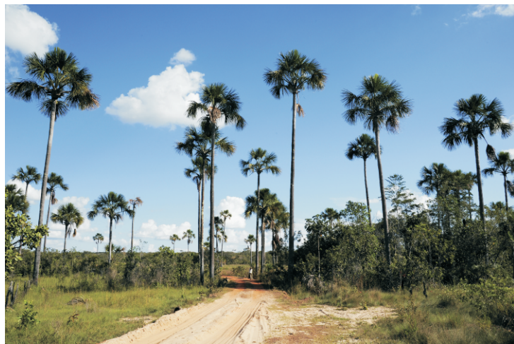
Parque Estadual Veredas do Peruaçu