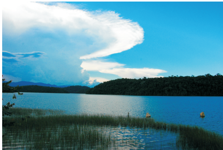
Parque Estadual do Rio Doce