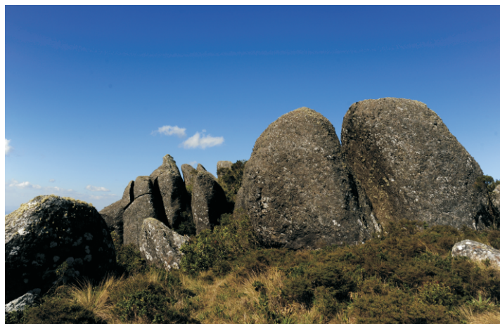
Parque Estadual Serra do Papagaio

5) LEME, Elton M. C. A família Bromeliaceae no Parque Estadual do Sumidouro. Viçosa: UFV, 2010. Relatório parcial ilustrado de pesquisa - Universidade Federal de Viçosa, 2010. - Herbarium Bradeanum - Realizado na Unidade de conservação: Parque Estadual Sumidouro. Referente a autorização: 001/10; 002/10; 003/10; 004/10; 005/10; 006/10.