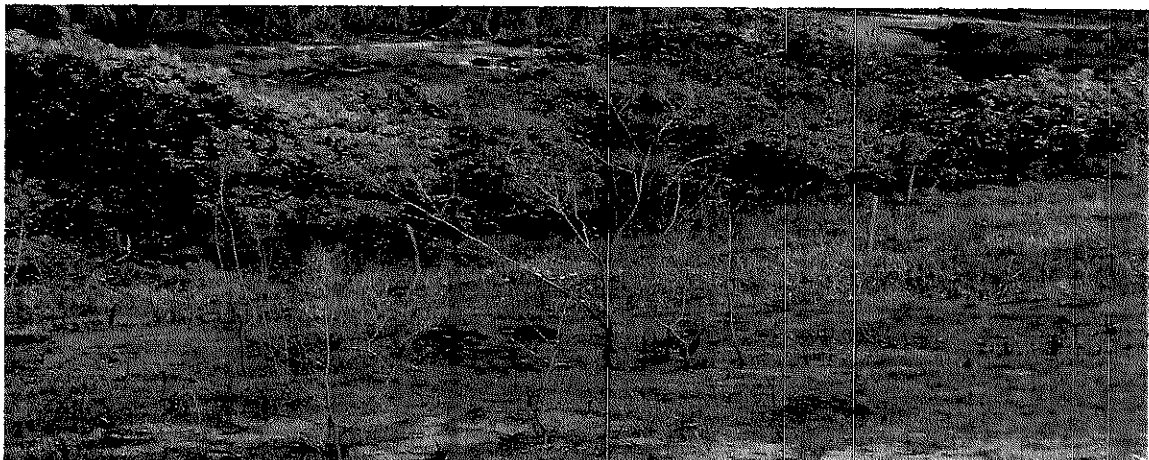
Fotos mostram a área onde houve o incêndio florestal (monocultura de cana-de-açúcar e área de preservação permanente.)