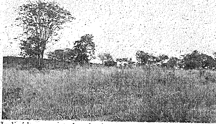
Indivíduos poupados do desmaté em meio à pastagem.