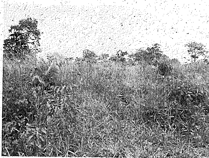
Pastagem formada na área desmatada.