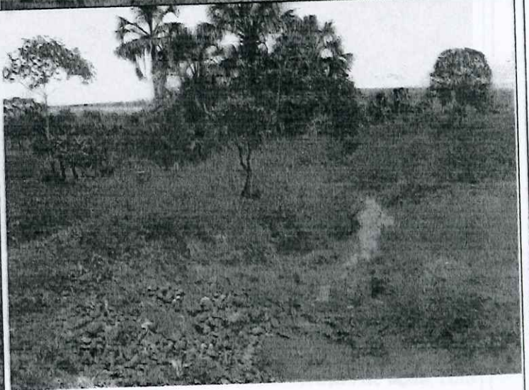
As Cacaueiras na Vereda (foto a esquerda)