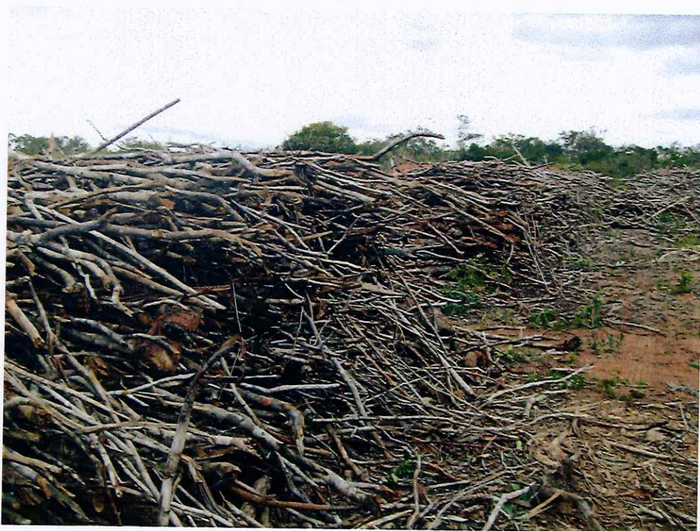
FOTO 02: Lenha nativa dentro da Área de Reserva Legal, na beira dos fornos de carvão.