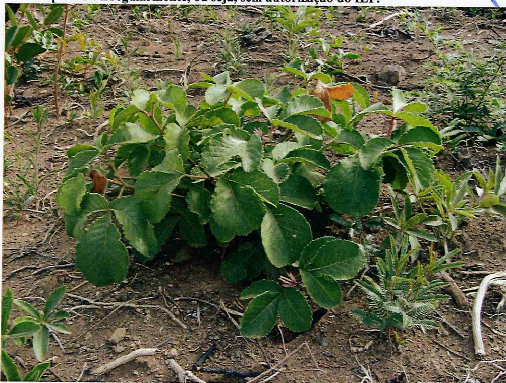
FOTO 05: Rebrotas de árvore da espécie Pequi cortada irregularmente.