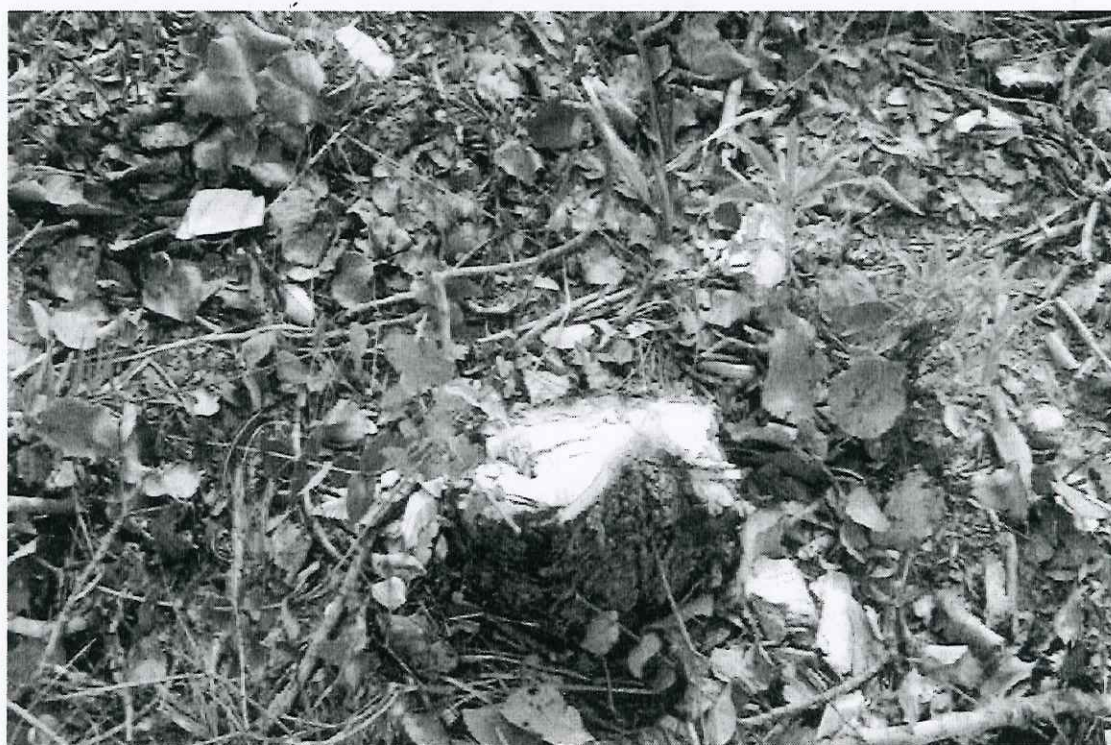
Foto 16: Nova vista parcial dos tocos de pequi encontrados na área roçada