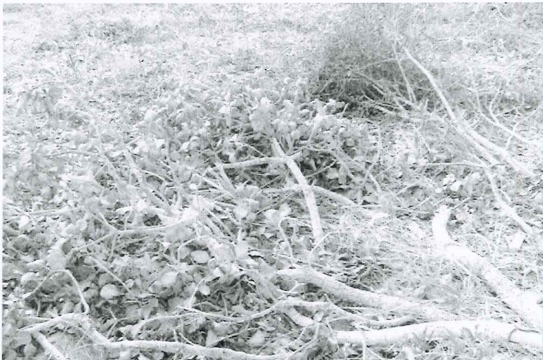
Foto 14: vista parcial das galhadas de pequi encontradas na área roçada