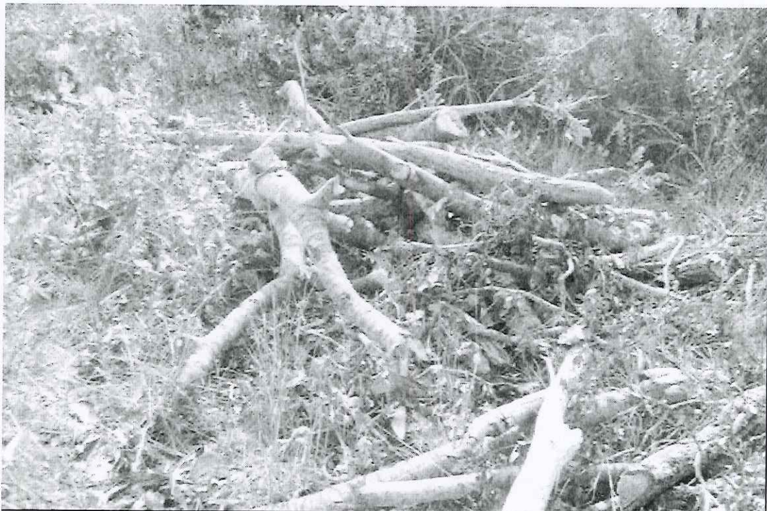
Foto 12: vista parcial das leiras de mangaba encontradas na trilha 4