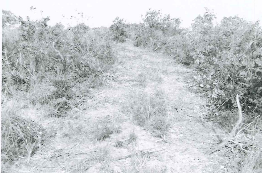
Foto 02: vista de uma das trilhas abertas em área próxima à submetida a roçada