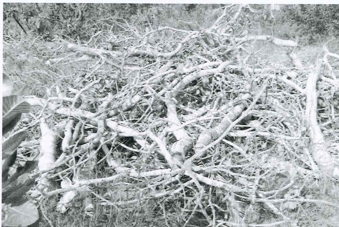
Foto 04: vista parcial das leiras com pequi encontradas na trilha 2