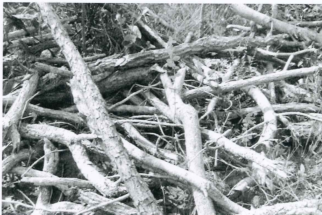
Foto 08: vista parcial das leiras com favela e outras espécies protegidas encontradas na trilha 4