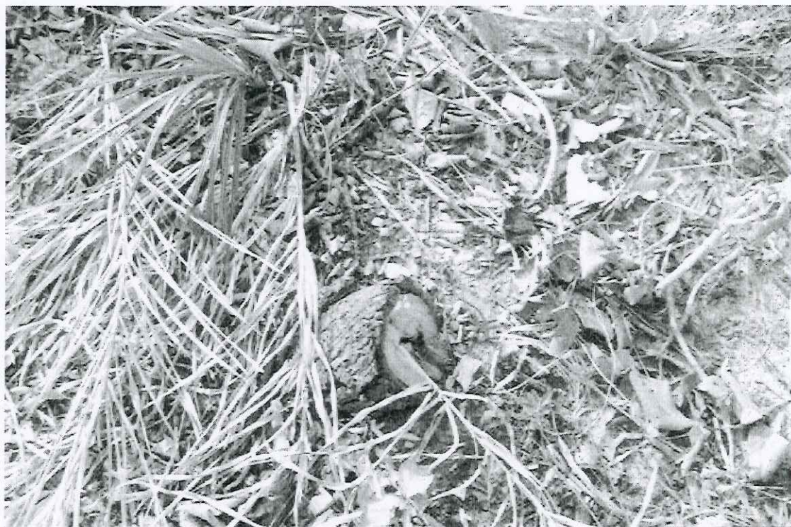
Foto 15: vista parcial dos tocos de pequi encontrados na área roçada