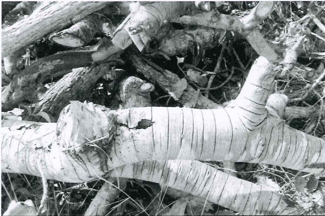
Foto 13: vista parcial das leiras de mangaba encontradas na trilha 4