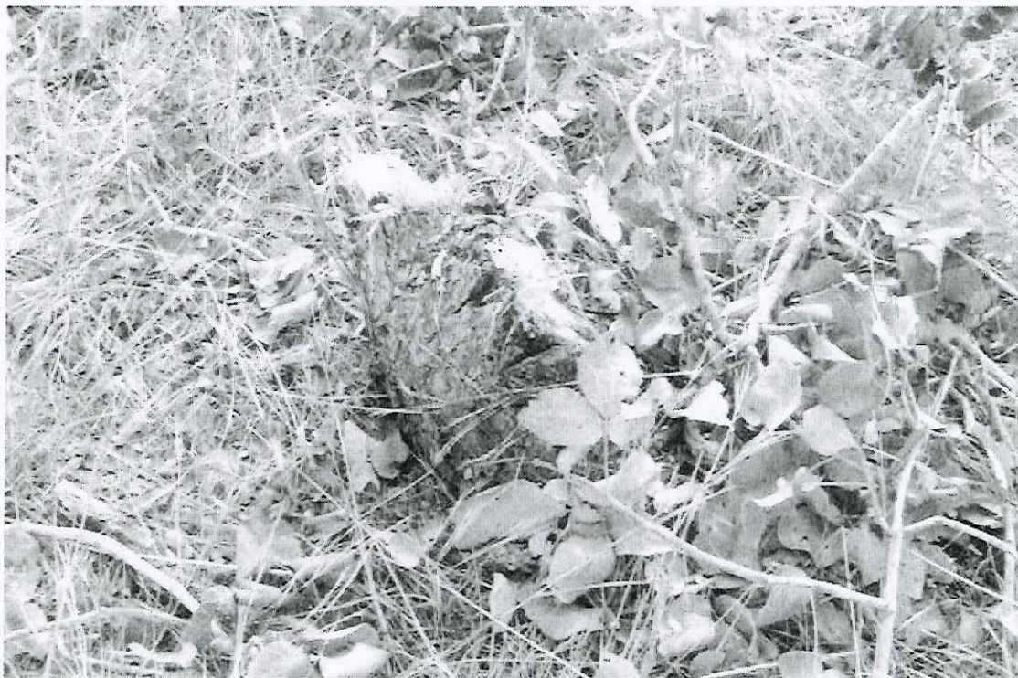
Foto 17: Nova vista parcial dos tocos de pequi encontrados na área roçada