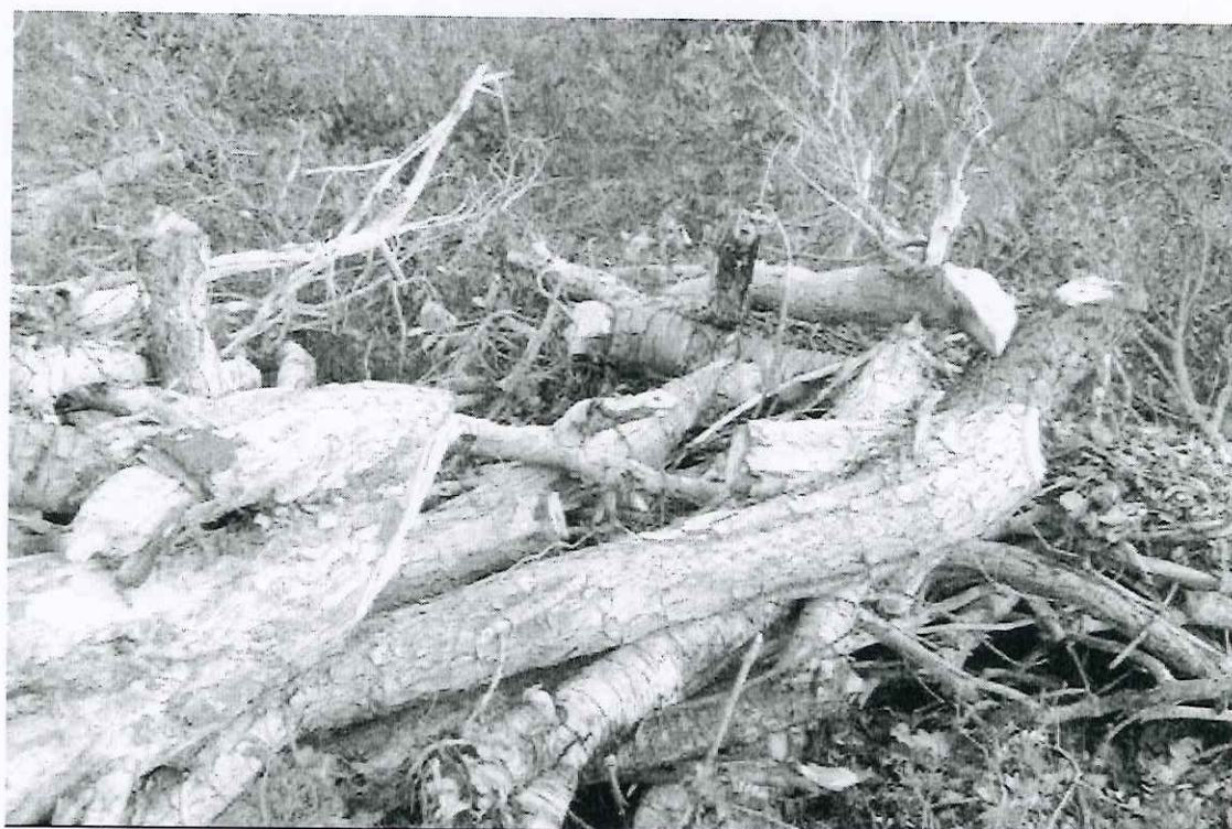
Foto 07: vista parcial das leiras com pequi encontradas na trilha 4