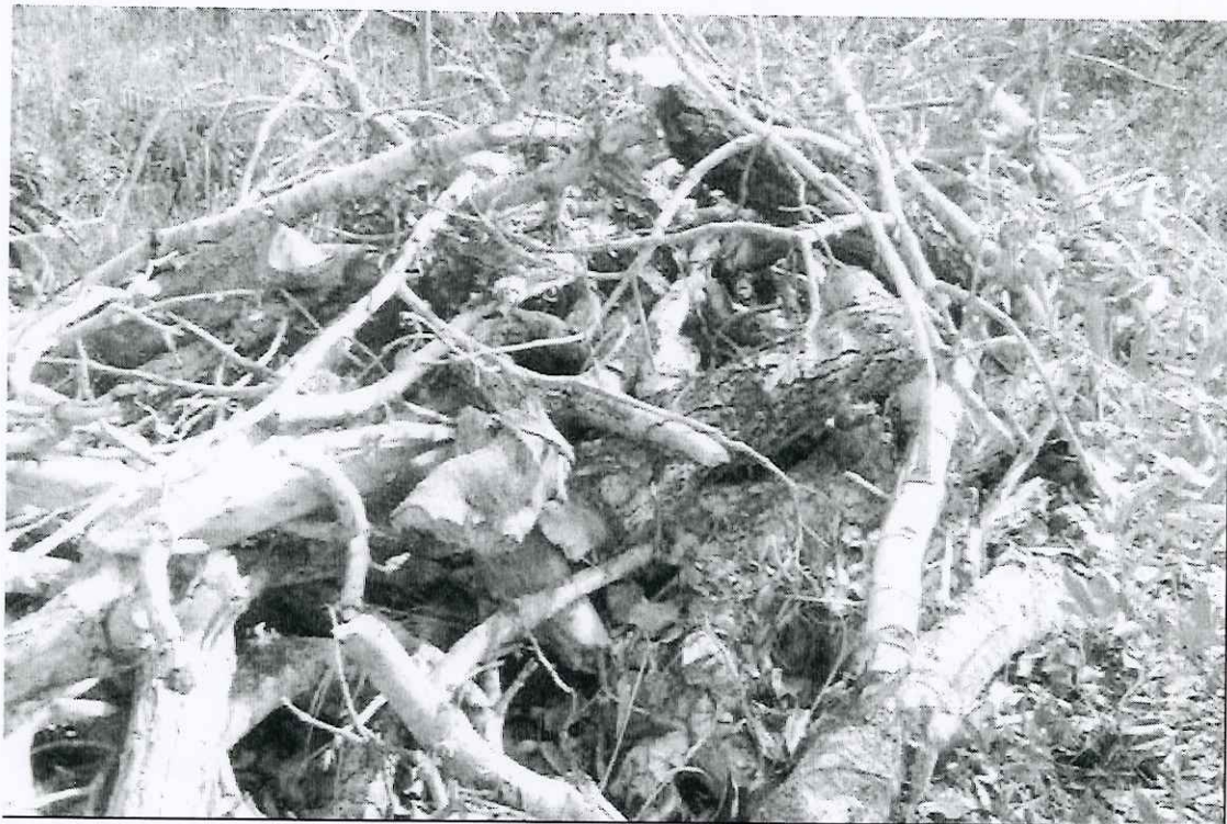
Foto 11: vista parcial das leiras de pequi encontradas na trilha 5