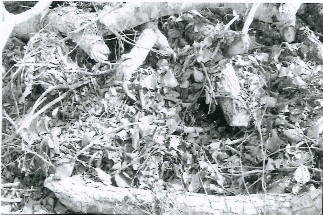
Foto 09: vista parcial das leiras e folhas de pequi encontradas na trilha 4