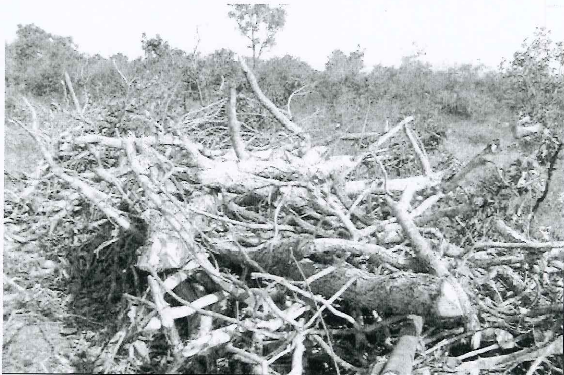
Foto 10: vista parcial das leiras de pequi encontradas na trilha 4