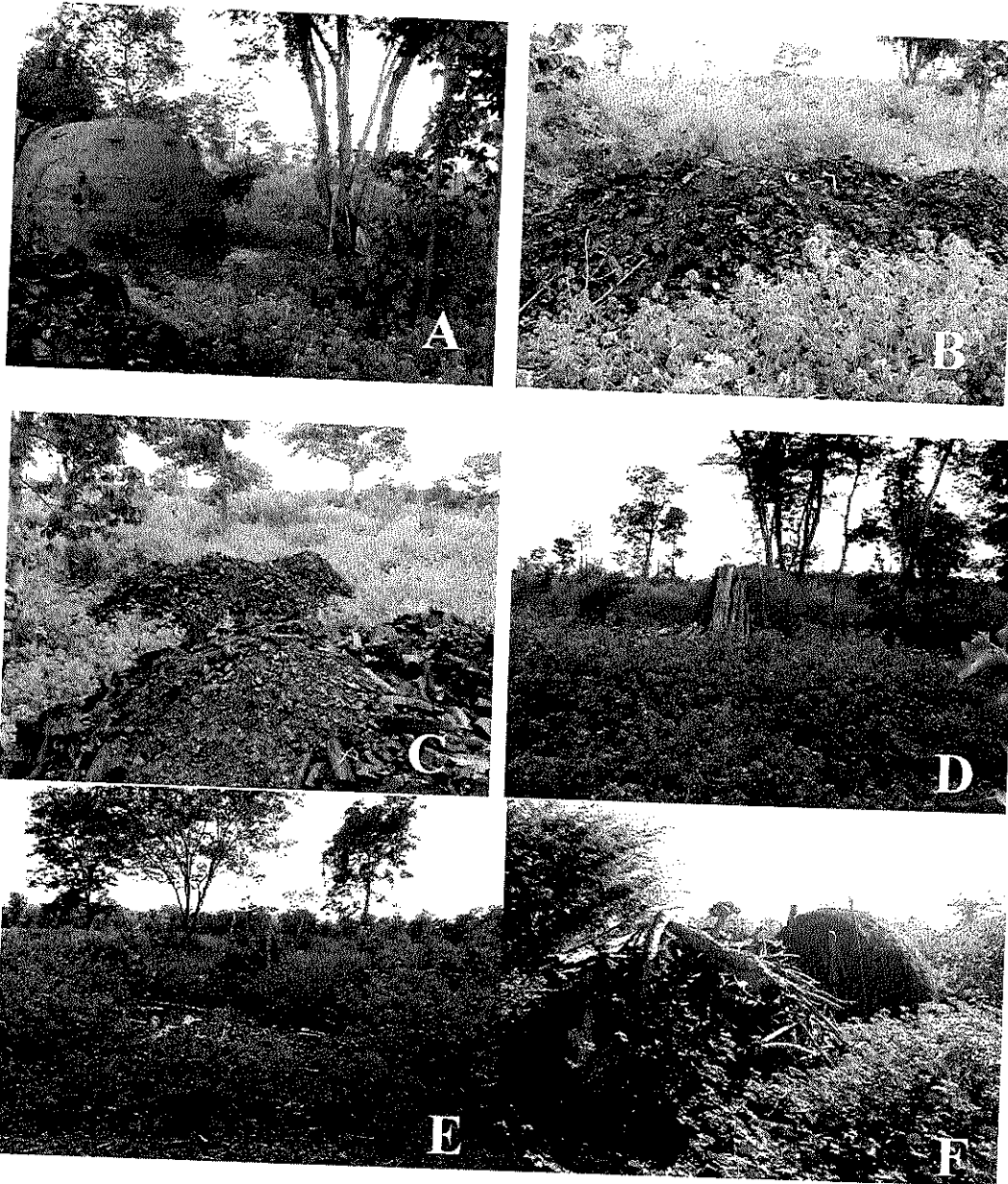
FIGURA 1: nas fotos acima em A, B e C observa-se o forno e o carvão na praça da área do vizinho de nome Carlos Lúcio de Almeida Mendes, em D,E e F outros fornos que já foram utilizados para carvoejamento ilegal.

ANEXO DAS FOTOS DOS FORNOS E MATERIAL LENHOSO CARVOEJADO E ENCONTRADO EM AREA VIZINHA SEGUNDO O DEPOIMENTO DO PROPRIO VISTORIANTE.