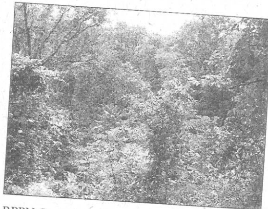
RPPN Grota da Serra 2