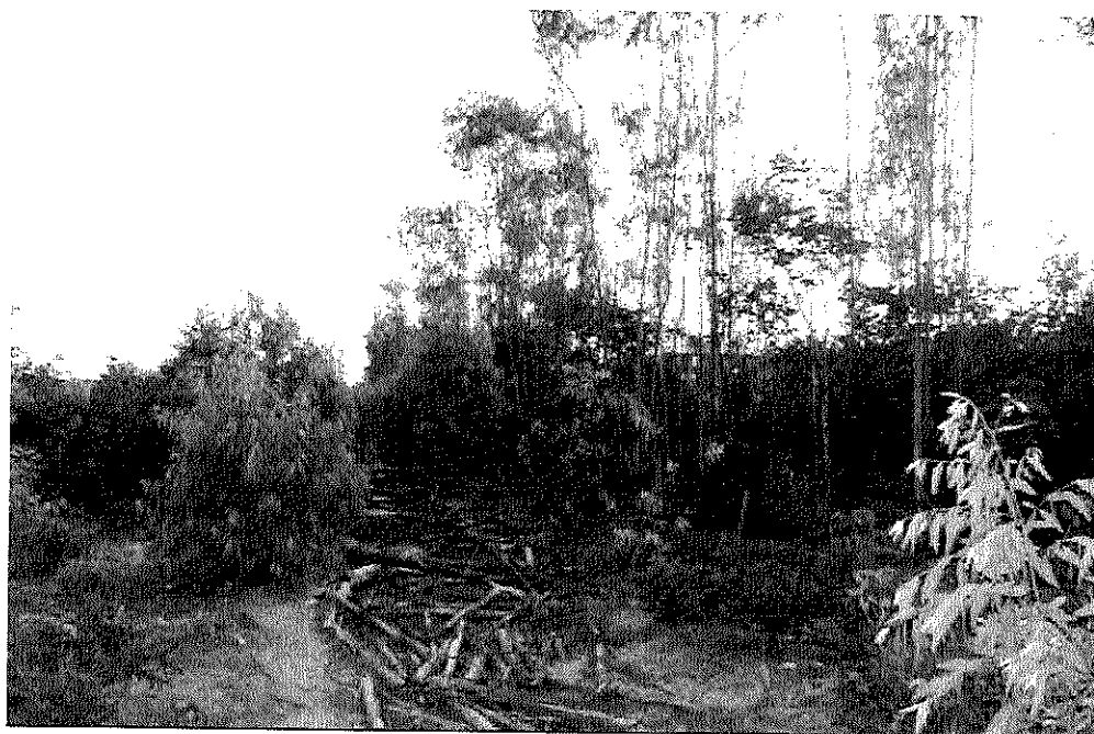
Foto 05: vista parcial de uma área explorada e outra ainda a explorar