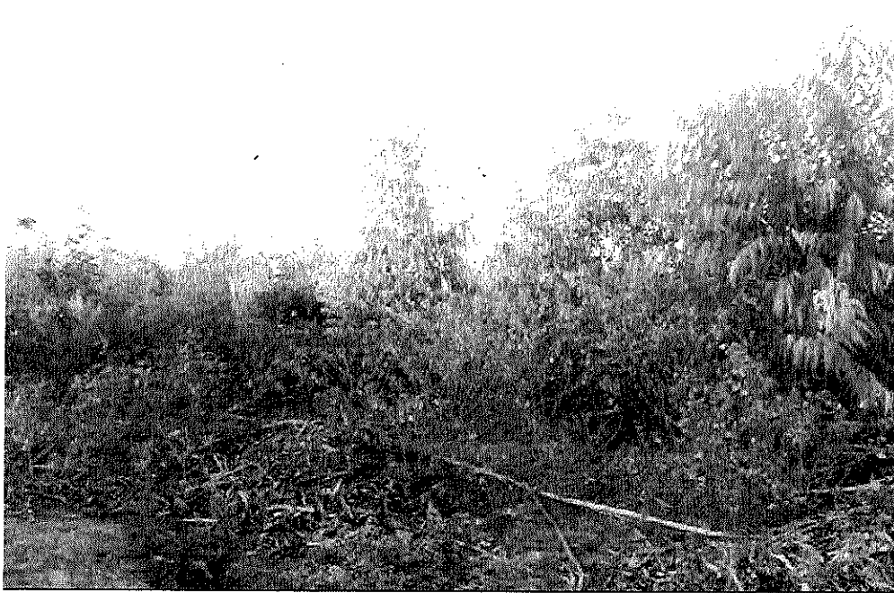
Foto 01 visão parcial da área explorada